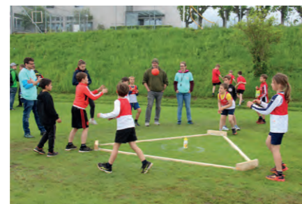
TV Inwil beim Dreieckball.