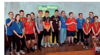
Teilnehmerfeld «CupMania on Tour». Die Baarer Sport Stacker brachten Kindern das Becherstapeln näher.