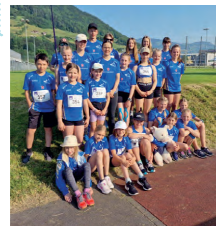
Foto: Erfolgreiches TV Ibach-Team