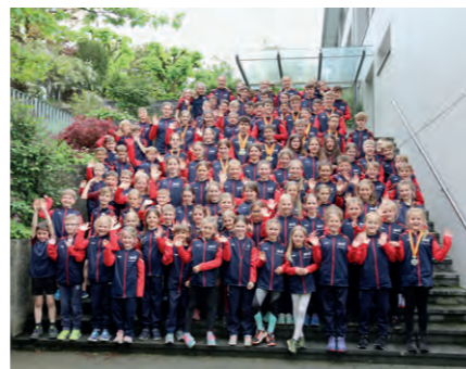
Hier schlummern Talente: Jugi des TV Grosswangen.